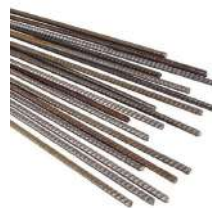
Des tiges de fer

Quels sont les éléments qui le composent ? (entourez les bonnes réponses)