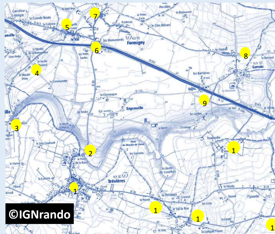
Carte détaillée et pas-à-pas du circuit 15 km—Trace GPX du circuit 30 km