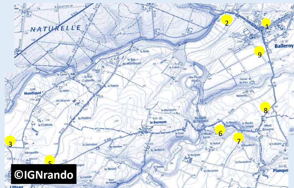
Carte détaillée et pas-à-pas du circuit 15 km—Trace GPX du circuit 34 km